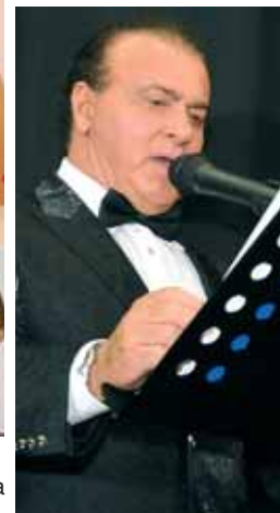
Apresentação do Internacional Focca Barreto