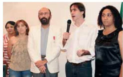
PIVI Projeto de Incentivo a Vida, desde 2001, parceiros da RTND® www.pivi.com.br

Cabelo & Maquiagem Inst. Embelleze - 11 5579 67 67