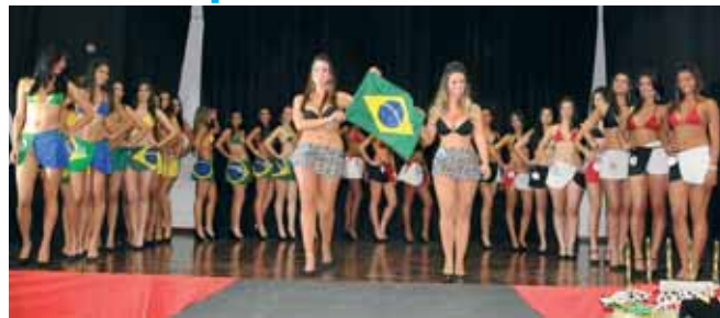
Coreografia, O Brasil se encontra em São Paulo, com flores Naturais

Passarela deslumbrante, com candidatas vestindo maiôs da Biquini Brasil