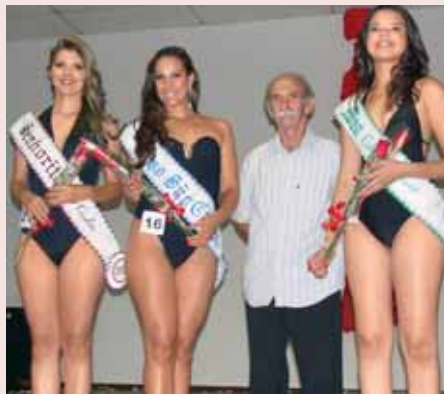
lenco, e suas vencedoras

Nossa Equipe hospedou-se no Mazo Apart Hotel - Av. Dr. Francisco Pereira Lopes, 2.600 - ao lado da USP e desfrutou da melhor comida de S. Carlos, a do Restaurante Roda Chopp - Av. S. Carlos, 2.603. E você perdeu essa !!! Por quê?