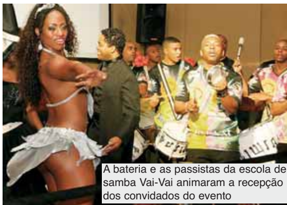
A bateria e as passistas da escola de samba Vai-Vai animaram a recepção dos convidados do evento

Canaã, localizada em Irecê, a 500 km de Salvador, na Bahia.