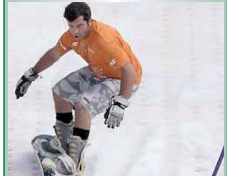
Participamos, em Curitiba.