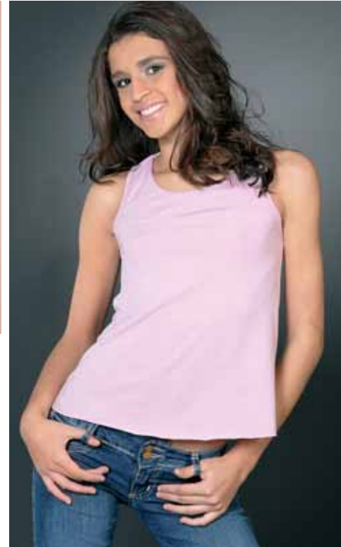
Direção & Arte • by Barbelo Fotos • Divulgação