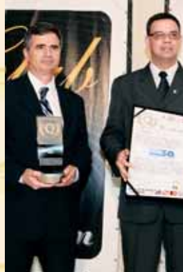
Premiada - Unisa