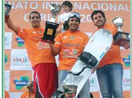
Dinho no podium em Curitiba. CS Team é Ouro.

Contábil Sumaré 52 anos de contabilidade empresarial contabilsumare@globocom www.contabilsumare.com.br www.csteam.com.br Fone: 11 3673 68 44