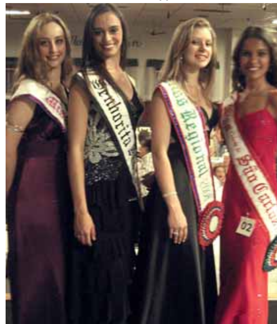
Vencedoras da ACONEI em São Carlos